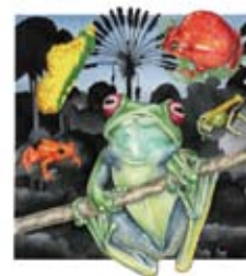
A Conservation Strategy for the Amphibians of Madagascar

Ny Conservation Strategy for the Amphibians of Madagascar (ACSAM) dia tetik'asa novolavolaina mba ahazoana miaro ireo sahona eto Madagasikara. Ny ACSAM dia mampiseho koa ezaka goavana izay dingana iray manandanja hanamorana ny ACAP eo amin'ny ambaratonga nasionaly. Ny ACSAM dia manana ny herijika ho alain-tahaka amin'ny fampandrosoana ireo lamin'asam-pirenena ho fikajiana ireo sahona any amin'ireo toerana hafa amin'izao tontolo izao. Ireo vaovao momba ny ACSAM dia hita sy avaozina hatrany ao amin'ny tranokala www.sahonagasy.org .