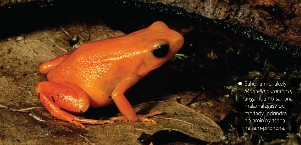
● Sahona menakely, Mantella aurantiaca , angamba no sahona malamalagasy be mpitady indrindra eo amin'ny tsena iraisam-pirehena.

Anisan'ireo toetra izay tena mampiavaka an'ireo karazana sahona malagasy dia ny lokony marevaka. Biby maro eran-tany no mampiasa ny loko ho fitaovana entina miaro-tena amin'ireo biby hafa mpihaza, ohatra amin'izany ireo sahona antsoina hoe "grenouilles flèches" any Amerika Atsimo (mampiasa ny loko ho fampitahorana na fampitandremana). Ireo fianankavimben'ny Mantellidae eto Madagasikara izay manana loko marevaka toy ny Mantella aurantiaca sy Mantella baroni , dia mitahiry singa simika "alkaloida" ao amin'ny hodiny ka mahatonga ireo biby mpihaza tsy hihinana azy ireo. Mpikaroka maro no mihevitra fa ny sahona dia mamokatra io poizina io vokatry ny fihinanany an'ireo bibikely toy ny vitsika, izay mitondra alcaloïda amin'ny vatany. Ankoatra ireo dia misy koa ireo sahona sasany izay mampiasa ho fiarovantena ny fiafenana. Misy amin'ireo karazana sahona malagasy ireo no mampiady ny loko-