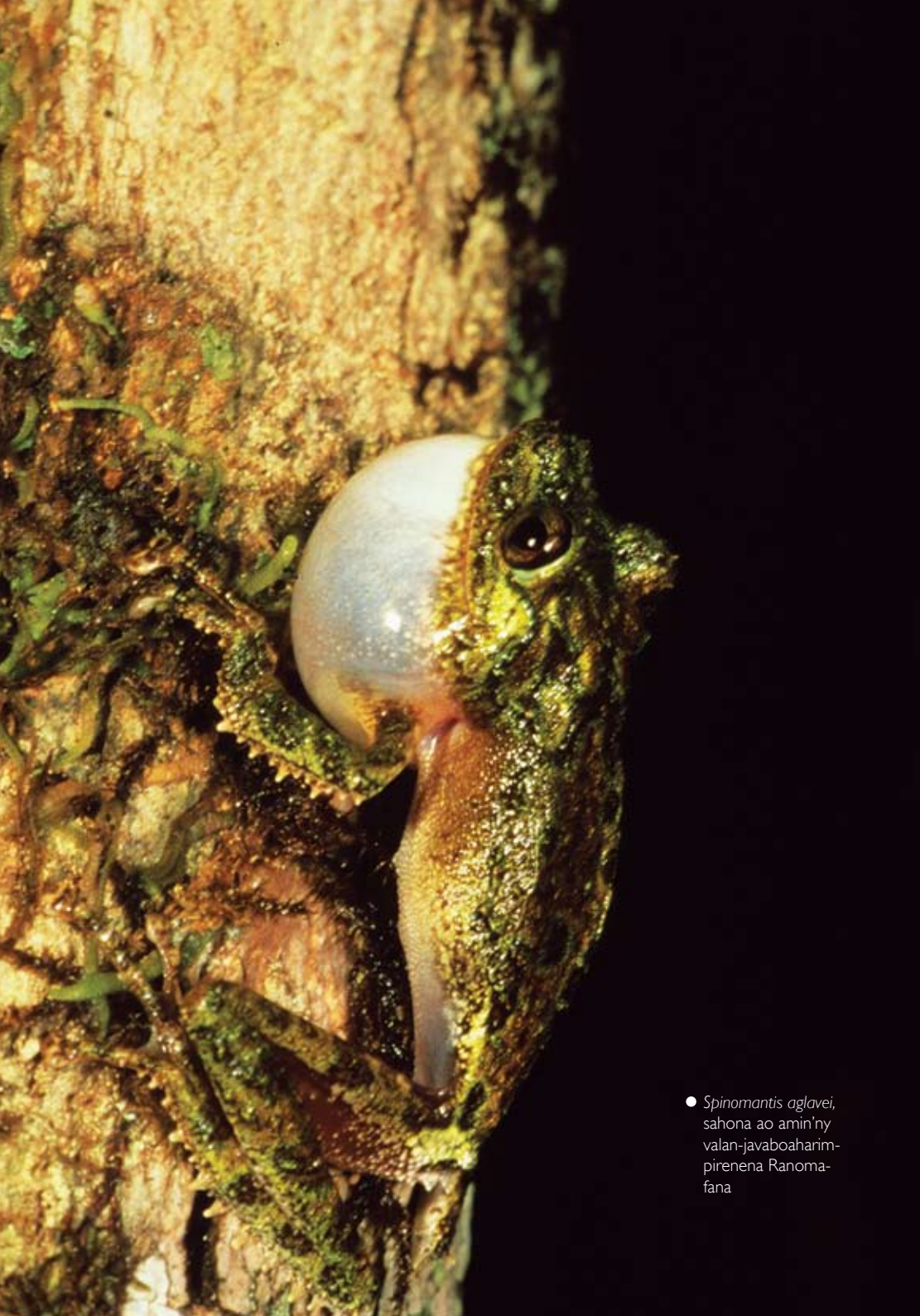
● Spinomantis aglavei , sahona ao amin'ny valan-javaboaharim-pirenena Ranomafana