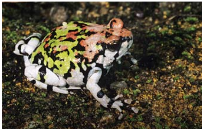
▼ Scaphiophryne gottlebei . Karazany iray antsoina hoe sahona havana (arc-en-ciel) noho ny lokony bemiray miavaka, sahona mampiavaka ny ao Isalo, tangoron-tendrombohitra maina iray ao atsimon'i Madagasikara.

Ny Boophis lichenoides efa matoy ohatra dia manana ny endrika entina miafina tsara ary ny tsi-