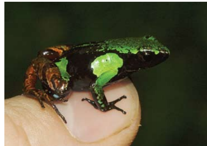
◀ Mantella nigricans mahafatifaty, miaina any amin'ireo ala mando avaratr'i Madagasikara.

Hoy ny Filoham-pirenena Malagasy, Marc Ravalomanana "tsy zavaboaharin'i Madagasikara ihany izy ireo fa an'izao tontolo izao ihany koa". Noho izany ny zavamananaina tsy manampaharoa sy miavaka eto Madagasikara, isan'izany ireo sahona mahatalanjona, dia vakoka sy lova ho an'ny olona rehetra ka tokony ampiana, arovana ary ankafizina. Andao hiara-hiasa miaraka amin'ny vahoaka Malagasy, vonona ny hanampy na dia fandraisana anjara kely ihany aza amin'ny fikajiana ireo karazan-javaboahary mahatalanjona ireo.