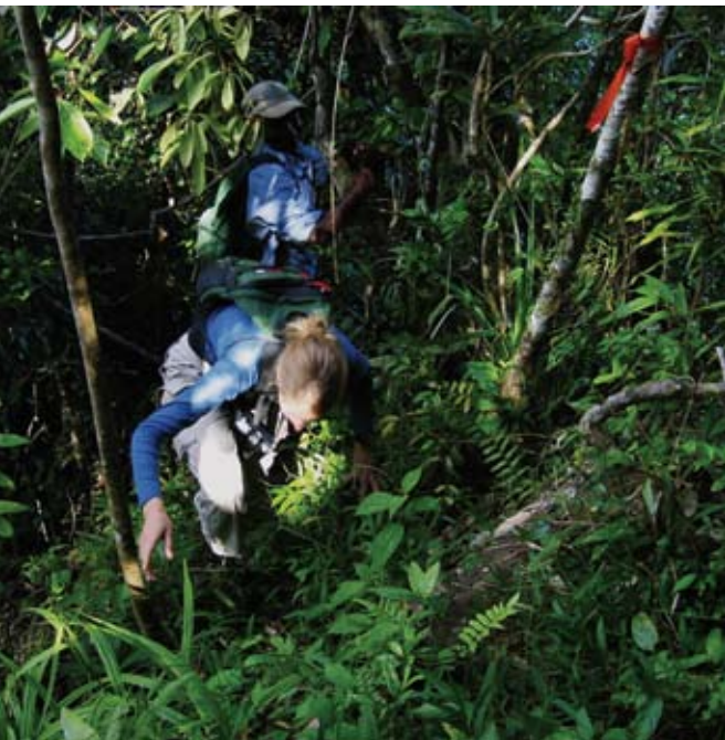
▲ Mitaky fahafahana sy fahazarana mandeha an-tongotra lavitra ny fikarohana momba ny sahona any anaty ala.

manampy ny fitondrana eto Madagasikara amin'ny fitantanana sy famahana ireo olana momba ny karazan-javamanainaina sy ny fiarovana, amin'ny alalan'ny famatsiam-bola sy ny fampitana traikefa ary koa ny fanohanana ireo tetik'asa momba ny fikarohana. Ireo tahirin'ala voajanahary sy ireo faritra arovana dia tsy afaka foronina raha tsy misy fahalalana mivaingana momba ny fiaipiainan'ireo karazana voafidy manokana. Ny momba ireo karazana sahona malagasy maro dia fahalalana kely no fantatra momba ny fiparitahany, ny hamaroan'ireo andiany, ny fomba tena fivoarany ary ny fiaipiainan'izy ireo amin'ny ankapobeny, izay mahatonga