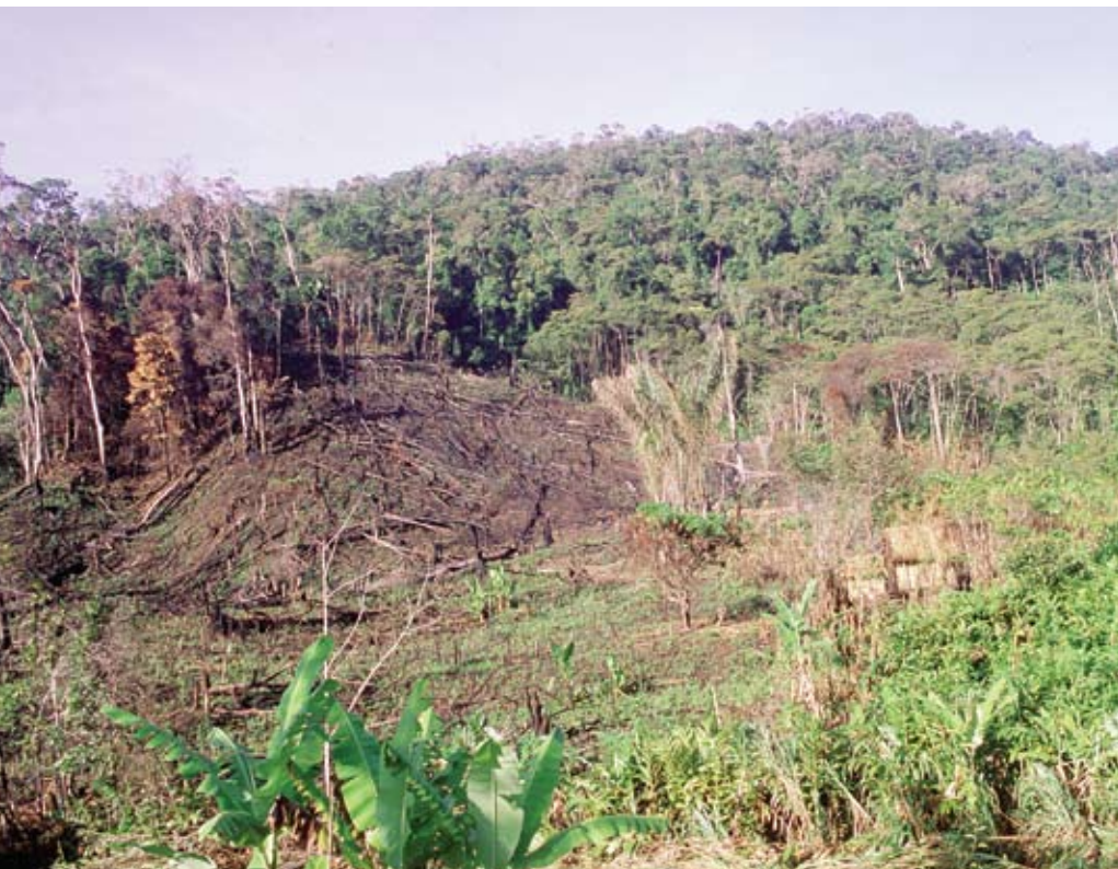
► Isan'ireo ala sisa tavela any amin'ny faritr'i Tolongoina, atsimo antsinanan'i Madagasikara. Toerana fiavian'ny sahona isan'ireo tandindomin-doza eto Madagasikara, Mantella bernhardi .

Ireo karazany tena miankina tanteraka amin'ny rano no tsy voatohintohina loatra ny fisiany amin'ny fiovaovan'ny toera-ponenana, satria izy ireo dia afaka miaina amin'ny ankamaroan'ireo sakeli-drano izay tsy dia voaloto loatra raha mbola eo ireo ala mando mifanila aminy, ary indrindra ireo renirano voafaritra ao anaty ala. Ireo karazana izay afaka miaina amin'ireo toerana maina dia efa natao hahazaka sady efa zatra kokoa amin'ny fiovan'ny toetr'andro