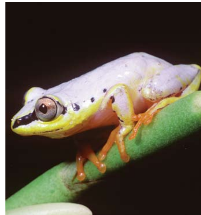
▼ Karazan-tsahona iray tena miparitaka sady mbola maro, Heterixalus madagascariensis . Mivelona eny amin'ireo toera-ponenana misokatra sy ireo feno bozaka ary matetika dia mitotra any ivelan'ny ala.

ingerim-piainany. Ireo karazana sahona miaina manamorona renirano dia manatody amin'ny tany akaiky moron-drano; ireo miaina ambony hazo kosa dia mamertraka izany amin'ny tendronkazo na laingon'ireo ravina, ambonin'ny toerana misyrano. Raha vao mivoatra ho tsiboboka izany atody izany dia miala amin'ireo vondron'atody ary milatsaka