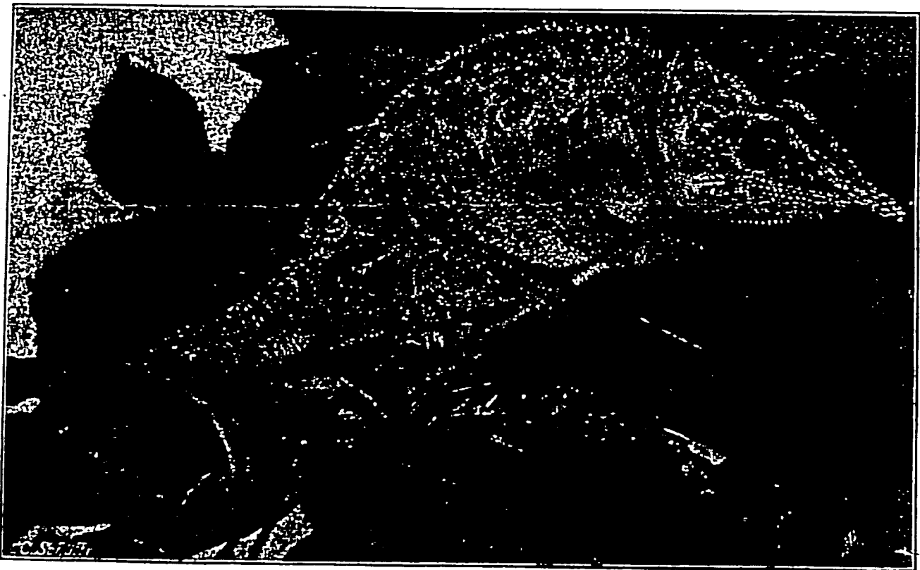
Originalaufnahme nach dem Leben für die „Blätter“ von Dr. E. Bade.

übertraf, und das sich, wie schon früher berichtet, einer beneidenswerten Gesundheit erfreute, anlässlich der Anwesenheit der anderen Chamäleone sich momentan mit einer geradezu wundervollen Prachtfärbung schmückte. Ich